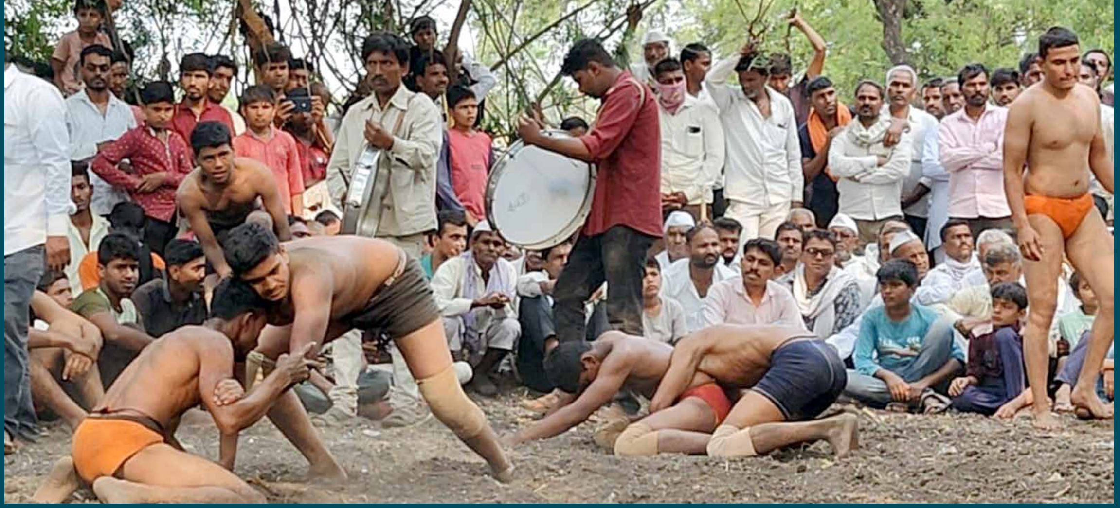
अंबड : तालुक्यातील लोणार भायगाव येथे प्रती वर्षीप्रमाणे याही वर्षी भव्य कुस्त्याची दंगल ग्रामस्थांच्या वतीने भरविण्यात आली होती. कुस्तीच्या या आखाड्यात जालना जिल्ह्यातील मल्ल -पहेलवानांसह, बीड, छत्रपती संभाजीनगर, परभणी, नगर या जिल्ह्यातील पहेलवान मंडळींनी या कुस्त्यात सहभाग घेतला.