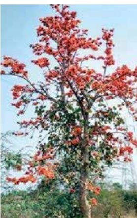
पळस फुलला, पळस फुलला लाल, केशरी गर्द रंगानी दुतर्णा शोभून दिसतात त्या फुललेल्या पळसानी