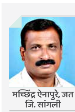
मच्छिंद्र ऐनापुरे, जत जि. सांगली

आता त्याला मिळणार्या मोफत आणि अनुदानावर आधारित योजना गमावण्याच्या भीती सतावत आहे. देशातील दहा राज्यांनी आपली कर्ज घेण्याची शेवटची सीमारेषादेखील ओलांडली आहे. आरबीआयच्या अहवालात असे म्हटले आहे की, जर या राज्यांनी मोफत वितरण योजना बंद केल्या नाहीत, तर राज्यांमधील विकासाची स्थिती श्रीलंका आणि पाकिस्तानसारखी होईल. या अहवालानुसार, देशातील 30 राज्यांनी एप्रिल 2022 ते डिसेंबर 2022 या नऊ महिन्यांच्या कालावधीत 2.28 लाख कोटी रुपयांचे कर्ज घेतले होते, तर जानेवारी 2023 ते मार्च 2023 या पुढील तीन महिन्यांत 3.34 लाख कोटी रुपयांचे कर्ज घेण्याच्या रंगेत समावेश होता. पंजाब, केरळ, बिहार, राजस्थान, पश्चिम बंगाल, आंध्र प्रदेश, उत्तर प्रदेश, हरियाणा, झारखंड, मध्य प्रदेश या आरबीआयच्या अहवालात घोषित केलेल्या दहा राज्यांची स्थिती अशी आहे की त्यांच्या एकूण उत्पन्नापैकी नव्वद टक्के पगार, निवृत्ती वेतन, कर्मचाऱ्यांचे व्याज आणि अनुदान यावर खर्च होत आहे. सर्व खर्च केल्यानंतर या राज्यांमध्ये विकासासाठी दहा टक्केही निधी शिल्लक राहत नाही. ही राज्ये घेतलेले कर्ज परत करू शकतील का, हाही प्रश्न आहे. परिस्थिती इतकी वाईट असतानाही निवडणूक जिंकण्यासाठीच्या प्रयत्नांमध्ये मुक्त घोषणा करण्यात कोणतेही सरकार मागे नाही. रिझर्व्ह बँकेच्या गणनेनुसार, सरकारच्या आर्थिक शिस्तित कर्जाचा बोजा त्या राज्यांच्या जीडीपीच्या 30 टक्क्यांपेक्षा जास्त नसावा, परंतु पंजाब 53.3 टक्के, राजस्थान 40 टक्के, बिहार 38, उत्तर प्रदेश 34, मध्य प्रदेश 32 टक्के ओझे घेऊन बसले आहेत. वित्तीय संस्था या