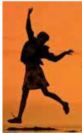
तुलाच आठवते डोळे मिटल्यावरती तुझ्याकडेच धावते

मन मोकळे मोकळे जसे पिलाचे रडणे तुझ्या नजरेच्या तीराने मन घायाळ हे होणे