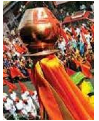
सर्वांना नूतन वर्ष आनंदाचे जावो हीच सदीच्छा नव वर्ष आणि गुढीपाडव्याच्या सर्वांना खूप खूप शुभेच्छा

नव्या वर्षी नवे स्वप्न पाहू देवाची लेकरे माणुसकीने राहू मानवात देव शोधू बंधूभावाने व एकजुटीने आपण सारे