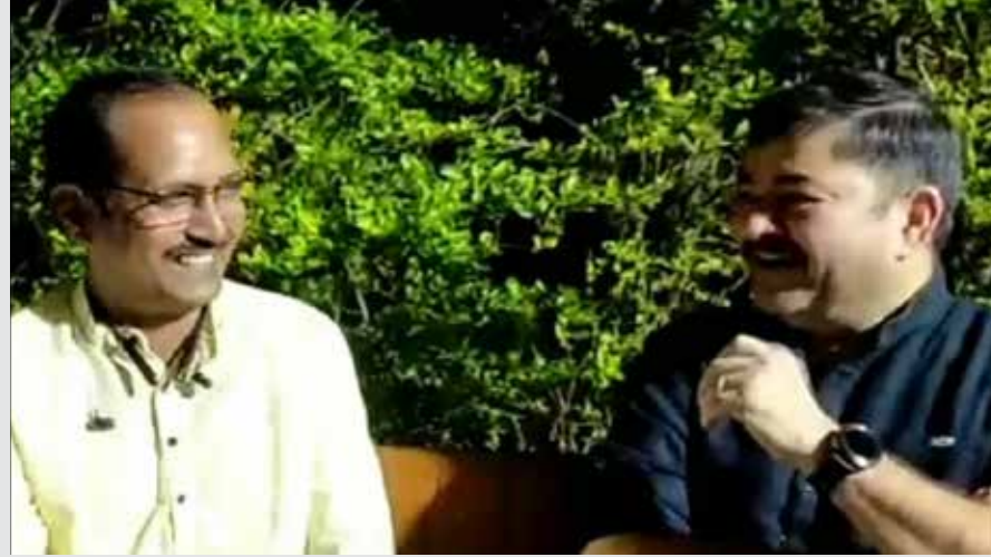
महाराष्ट्राचे पहिले मुख्यमंत्री यशवंतराव चव्हाण ते विलासराव देशमुख यांच्यापर्यंत महाराष्ट्रातील नेत्यांची संगीत, साहित्य व नाटकाची रसिकता

जालना शहरात एक मोठे नाट्यगृह असूनही शहराबाहेर एका लॉनवर नाटकाचा प्रयोग त्यांना करावा लागला. राज्यातील सर्वच नाट्यगृहे सुधारण्यासाठी काय करता येईल? या प्रश्नावर ते म्हणाले की, "हे खरे तर अखिल भारतीय नाट्य परिषदेचे काम आहे आणि सरकारकडे सतत पाठपुरावा करून हे काम परिषदेने करून घेतले पाहिजे. कलावंत म्हणून आम्हीही वेळोवेळी आवाज उठवतोच आहोत. राज्याच्या यंदाच्या अर्थसंकल्पात नाट्यगृहांसाठी 50 कोटी रुपयांचा निधी राखीव ठेवण्यात आला आहे. त्याचा उपयोग नाट्यगृहांसाठीच व्हायला हवा. या निधीला भलतीकडेच वाट फुटू नये याकडेही नाट्य परिषदेने लक्ष द्यायला पाहिजे. नाट्यगृहे सुसज्ज झाली तरच प्रेक्षकांना नाटकाचा नीट आस्वाद घेता येईल. नव्या पिढीलाही नाटकाची गोडी लागेल."