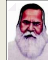
स्वर्वेद रचनाकार अनंत श्री सद्गुरू सदाफल देवजी महाराज

काल शीश मंडराड्या, क्षण-क्षण ढूढत दाव । सो कवनी विधि सोवही, ताहि मरम जो पाव ॥१८९॥ (स्वर्वेद षष्ठ मण्डल षष्ठ अध्याय) ०६/०६/१८९ मूळ भाष्याचा मराठी अनुवाद : काळ प्रत्येक जीवाच्या डोक्यावर धिरट्या घालत आहे. तो प्रत्येक क्षणाला त्याला मारण्यासाठी संधी शोधत आहे. ज्याला काळाच्या या रूपाचे ज्ञान होईल ती व्यक्ती निश्चितपणे कशी झोपू शकेल ?