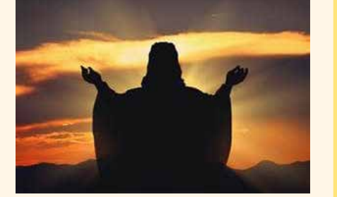
वळविल्यामुळे भगवंतावर प्रेम जडेल; याकरिता काही वेगळे करणे नको. हा आपलेपणा निर्माण होण्यासाठी, भगवंतावाचून आपले नडतेही भावना झाली पाहिजे. याकरिता आपण त्याच्या आर्खंड सहवासात राहण्याचा प्रयत्न केला पाहिजे. त्याच्या नामस्मरणानेच ही गोष्ट सहज शक्य आहे. वाचलेले विसरेल, पाहिलेले विसरेल, कृती केलेली विसरेल, पण अंतःकरणात घट्ट धरलेले नाम कधी विसरायचे नाही.

प्रयोगशाळा समजावी. आजपर्यंतचा आपला अनुभव पाहिला तर आपण 'केले' असे थोडेच असते. म्हणून, परिस्थितीबद्दल फारशी काळजी न करता आपण आपले कर्तव्य तेवढे योग्य रीतीने करावे, आपल्या वृत्तीवर परिणाम होऊ देऊ नये. प्रत्येक गोष्ट घडायला योग्य वेळकाळ यायला लागतो. तेव्हा कर्तव्यबुद्धीने वागून काय ते करा, आणि 'भगवंता, हा प्रपंच तुझ्या इच्छेने चालला आहे' असे म्हणा, म्हणजे आपोआप भगवंताचे प्रेम लागेल. प्रपंचातले जे आपलेपण आहे ते भगवंताकडे वळवा. घरातल्या मंडळींवर निःस्वार्थबुद्धीने प्रेम करायला शिका, म्हणजे परमार्थ आपोआप साधेल, आणि आपलेपणा भगवंताकडे