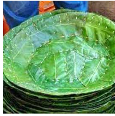
कालबाह्य होत असल्याचे चित्र ग्रामीण भागासह शहरातही दिसून येत आहे. मोहाच्या

सुलतानपूर : लग्न असो, वा कुठल्याही धार्मिक कार्यक्रमात असो त्यासाठी पंगतीला पत्रावळ असणे आवश्यक आहेत. पूर्वी पानाच्या पत्रावळी, द्रोणाशिवाय पंगती होत नसत. मात्र, आता सर्वत्र आधुनिक तंत्रज्ञानाचा वापर करून यंत्राच्या सहाय्याने प्लॉस्टिक व थर्माकोल पत्रावळी द्रोण ग्लास, चहाकप बनविले जाऊ लागले आहेत. या पत्रावळी व द्रोण कमी भावात उपलब्ध होत असल्याने आणि त्याची फॅशन असल्याने पानांपासून बनविलेल्या पत्रावळी-द्रोण