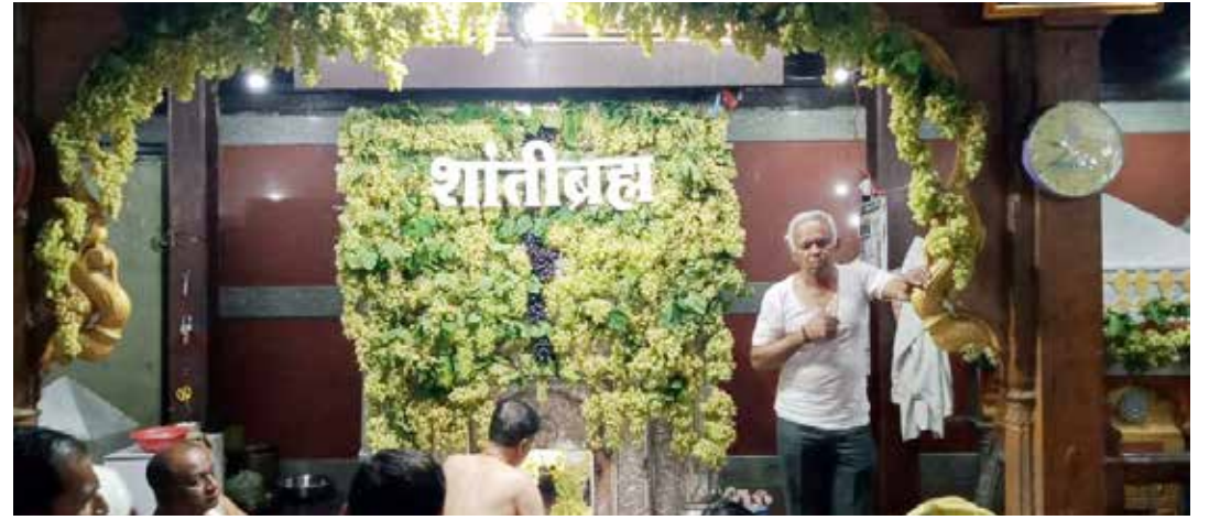
नाथषष्ठीनिमित्त संत एकनाथ महाराज यांच्या समाधीस्थळी अगुंरांची आकर्षक आरास करण्यात आली.