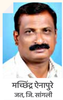
मच्छिंद्र ऐनापुरे जत, जि. सांगली

आजच्या युगात महिला प्रत्येक क्षेत्रात पुरुषांच्या बरोबरीने पाऊल टाकून चालत आहेत, पण तरीही ती अनेक बाबतीत मागेच आहेत. त्यापैकी एक प्रमुख क्षेत्र म्हणजे महिलांची आर्थिक साक्षरता. या बाबतीत फक्त गरीब, ग्रामीण आणि अशिक्षित महिलाच मागे नाहीत, तर शहरी मध्यमवर्गीय आणि उच्चवर्गीय सुशिक्षित महिलांमध्येही आर्थिक साक्षरता आणि माहितीचा अभाव दिसून येतो. 2020-21 मध्ये ग्लोबल फायनान्शियल लिटरसी एक्सलन्स सेंटर (GFLE) ने प्रसिद्ध केलेल्या अहवालानुसार, भारतीय प्रौढ लोकसंख्येपैकी केवळ 24 टक्के लोक आर्थिक बाबतीत साक्षर आहेत. इतर प्रमुख उद्योगांमध्ये अर्थव्यवस्थांच्या तुलनेत भारताचा आर्थिक साक्षरता दर सर्वात कमी आहे. महिलांच्या बाबतीत तर परिस्थिती अधिक चिंताजनक आहे. ते राज्यानुसार 4 टक्के ते 50 टक्क्यांपर्यंत आहे.