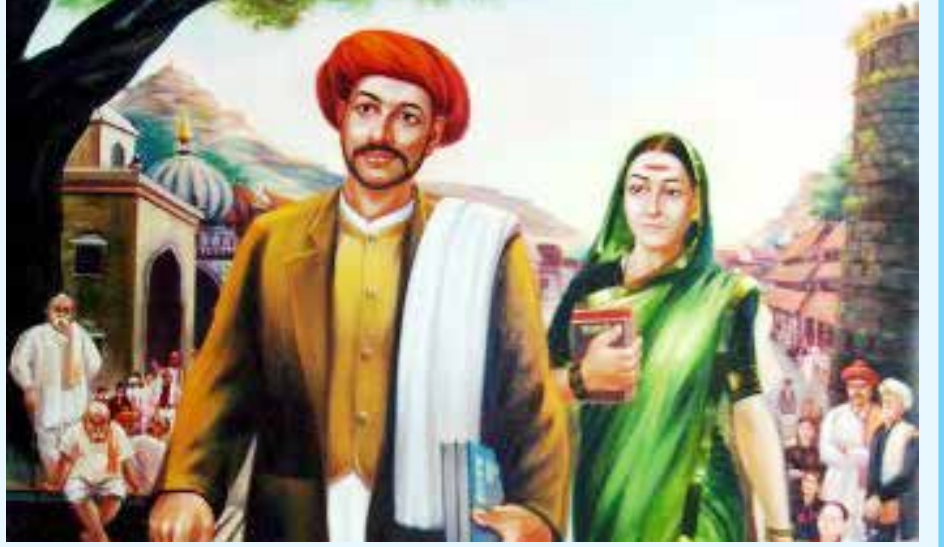
बहुजनांचे शिक्षण का महत्त्वाचा विषय असल्याचे स्पष्टपणे जाणवते. कविता, निबंध, भाषणे व पत्रांमधून त्यांनी शिक्षणाची दिशा स्पष्टपणे मांडली. त्यांनी

आहे शिक्षण मार्ग हा | शिक्षणाने येई मनुष्यत्व | पशुत्व हटते पहा | केवळ शिक्षण प्राप्तीनेच 'मानव ते मनुष्य' असा प्रवास सुखकर होऊ शकतो, असे सावित्रीमाई सांगतात. इतर प्राणी आणि मनुष्यप्राणी यांच्यामध्ये असणारा मुलभूत फरक म्हणजे मनुष्याकडे असलेली ज्ञानप्राप्तीचा प्रचंड मनुष्य ज्ञानप्राप्ती आस. हे ओढीने आजचा आधुनिक वाटचाल करीत आहे, त्यासाठीची पहिली पायरी म्हणजे शिक्षण होय. विज्ञान आणि तत्त्वज्ञानाच्या अभ्यासामुळेच मनुष्याचा विकास होणार आहे, असेच सावित्रीमाईंना सुचवायचे असेल, म्हणून अनिहाय पोटतिडकीने त्याम्हणतात- त्याचा अंगीकार करील ... यावरून जोतीबा व सावित्रीबाई यांच्या वैयक्तिक पत्रव्यवहारात सुद्धा शिक्षणाची चर्चा घडून येत असे, असे स्पष्टपणे दिसते. 'विद्यादान' या निबंधात, " शूद्रादी अतिशूद्रांजवळ निःसंशय अनेक गुण वसत असून अज्ञानामुळे त्यांना आपल्या बुद्धीचा व कौशल्याचा उपयोग कसा व कोठे करावा हे माहित नाही असे लिहितात. यावरून सावित्रीमाईंच्या चिंतनात