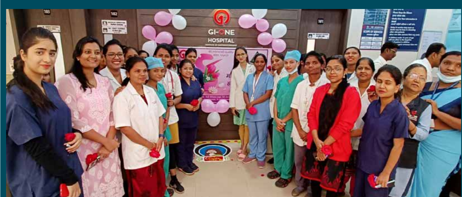
जी आय वन हॉस्पिटलमध्ये महिलादिन उत्साहात साजरा करण्यात आला. हॉस्पिटलमधील सर्व महिला स्टाफला यावेळी गुलाब पुष्प देऊन सत्कार करण्यात आला. यावेळी हॉस्पिटलचे सर्व संचालक आणि सर्व कर्मचारी उपस्थित होते.

आहेत. सर फाऊंडेशनच्या वतीने घेण्यात आलेल्या 'राष्ट्रीयस्तर शैक्षणिक नवोपक्रम स्पर्धा २०२३' मधून या शिक्षकांची निवड करण्यात आली आहे. 'नवोन्मेष' या प्रकल्पांतर्गत हे अवॉर्ड प्रदान करण्यात आले आहेत. शिक्षकांनी विद्यार्थ्यांच्या गुणवत्ता वाढीसाठी केलेल्या नाविन्यपूर्ण शैक्षणिक प्रयोगांच्या आधारावर तज्ज्ञ कमिटीमार्फत ही निवड केली जाते. या पुरस्काराचे वितरण ४ व ५ मार्च २०२३ ला झालेल्या विशेष 'एज्युकेशनल इनोव्हेशनस कॉन्फरन्स' मध्ये झाले. सिंहगड इन्स्टिट्यूट, केगाव, सोलापूर याठिकाणी झालेल्या या 'कॉन्फरन्स' मध्ये विविध विषयांवर शैक्षणिक मंथन, शिक्षणतज्ज्ञांचे व्याख्यान, परिसंवाद, गटचर्चा, नाविन्यपूर्ण शैक्षणिक प्रयोगाचे सादरीकरण, पुरस्कार वितरण अशा विविध कार्यक्रमाची मेजवानी सहभागी शिक्षकांना मिळाली.