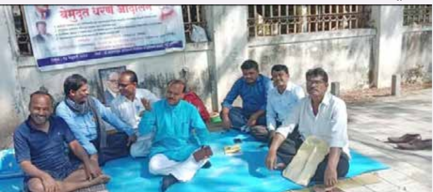
पक्षात काम करणारे मातंग समाजाचे काही नेते मंडळी माझे पक्षात कसे बल वाढेल व स्व फायदा कसा होईल ही भावना ठेवून काही काम करताना दिसत होते परंतु सत्ताधारी पक्षात काम करणारे नेते हे विसरले आहेत की काय जर समाजाचे नेतृत्व हे सत्ताधारी पक्षाचा भाग असेल आणि अशा नेत्याला आंदोलन

रोजी महाराष्ट्राच्या राजधानीत मुंबईतील आझाद मैदानावर मातंग समाजाने जवाब दो आंदोलन झाले या आंदोलनात सरकारला आमचा वाटा, हिस्साचा जांब विचारण्यात आला सामाजिक संघटना व राजकीय पक्ष आणि राजकीय नेते आंदोलनात सहभागी होते काही सत्ताधारी पक्षातील नेते होते तर काही विरोधी पक्षातील. भाजपा शिंदे गट सत्ताधारी पक्षाचे आमदार मंत्री शंभूराज देसाई यांनी या सभेला हजेरी लावली व निवेदन स्विकारून आश्वासनही दिले सत्ताधारी