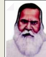
स्वर्वेद रचनाकार अनन्त श्री सद्गुरू सदाफल देवजी महाराज

काटे पर फिर फिर उगे, किशलय पल्लव चार । है अस्वस्थ माया जगत, फूल फलन विस्तार ॥३२॥ (स्वर्वेद पंचम मण्डल दशम अध्याय) ०५/१०/३२ मूळ भाष्याचा मराठी अनुवाद : माया रूपी अश्वत्थ वृक्ष छोटल्या नंतरही त्यास पुन्हा चार नविन कोमल पाने फुटतात आणि त्याच्या फूल-फळांद्वारे पुन्हा या माया जगताचा विस्तार होऊ लागतो.