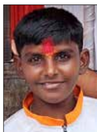
गांवात कळताच कडलास गांवावर