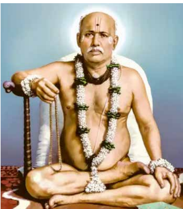
मांडला आणि तो खेळलो; त्यामुळे त्याचे सुखदुःख मला कधी बाधले नाही. नाम ज्यायची इच्छा पूर्ण झाली नाही म्हणून मी पुन्हा जन्मास आलो. मला तुम्ही सगळे रामरूप दिसत आहात.

इथून जाणाऱ्या मंडळींना निरोप देताना मला खरोखरच फार वाईट वाटते. पुन्हा आपली भेट होईल की नाही ते काही सांगता येत नाही. तुम्ही सर्वांनी एकमेकांशी अत्यंत प्रेमाने वागा. प्रेमाने जग जिंकता येते. तुम्ही माझ्यापासून जनप्रियत्व शिका. मला जनप्रियत्व फार आवडते. कारण जो लोकांना आवडतो, तोच भगवंताला आवडतो. जो निःस्वार्थी असेल त्यालाच जनप्रियत्व येईल. जो भगवंताच्या इच्छेने वागेल त्यालाच जनप्रियत्व येईल. आपण आपल्यासाठी जे करतो ते सगळ्यांसाठी करणे, हे भगवंताला आवडते. आपण आपल्यापुरते न पाहता सर्व ठिकाणी भगवंत आहे असे पहावे. प्रत्येकाला आपण हवेसे वाटले पाहिजे. असे वाटण्यासाठी लोकांच्या मनासारखेच वागले पाहिजे किंवा त्यांना आवडेल तेच बोलले पाहिजे असे नाही. प्रेम करायला कशाचीही जरूरी लागत नाही; पैसा तर बिलकूल लागत नाही, हे मी माझ्या अनुभवावरून सांगतो. जगात कुणी कधी भोगली नसेल एवढी गरिबी मी भोगली आहे. अशा गरिबीमध्ये राहूनही माझे अनुसंधान टिकले, मग तुम्हाला ते टिकवायला काय हरकत असावी ? मी जर काही केले असेल तर मी कधीही कुणाचे अंतःकरण दुखवले नाही. तेवढे तुम्ही सांभाळा. जो जो कोणी मला भेटला, तो तो मी आपलाच मानला. मी नुसता खेळ