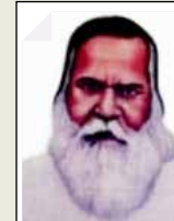
स्वर्वेद रचनाकार अनन्त श्री सद्गुरू सदाफल देवजी महाराज

धर्म कर्म संसार में, सो सब मन कर रूप । जन्म मरण दुख सुख सभी, जीव परे भवकूप ॥२५॥ (स्वर्वेद पंचम मण्डल द्वितीय अध्याय) ०५/०२/२५ मूळ भाष्याचा मराठी अनुवाद : जगात जेवढे धर्म, कर्मकांड आहेत, ते सर्व मनाचेच स्वरूप आहे. यांच्या द्वारेच जीव या भवसागरात पुन्हा पुन्हा येऊन जन्म-मरण तसेच समस्त सुख-दुःखाला प्राप्त करीत आहे.