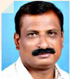
मच्छिंद्र ऐनापुरे जत, जि. सांगली