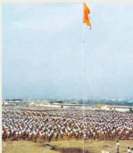
तळजाईच्या पठारावर दोन महिने रात्रंदिवस राबत होते. शिबिराला आलेल्या स्वयंसेवकांसाठी छत्तीस

पुणे : पुण्यातील तळजाई टेकडीच्या पठारावर राष्ट्रीय स्वयंसेवक संघाने भरवलेल्या 'प्रांतिक शिबिराला' शनिवारी (१४ जानेवारी) चाळीस वर्षे पूर्ण होत आहेत. तळजाईच्या पठारावर दोनशे एकर जागेवर हे शिबिर उभारण्यात आले होते आणि १४ १५ १६ जानेवारी १९८३ असे तीन दिवस चाललेल्या या शिबिरात तब्बल पस्तीस हजार संघस्वयंसेवकांची उपस्थिती होती. शिबिराला चाळीस वर्षे पूर्ण होत असल्याच्या निमित्ताने स्वयंसेवकांकडून या शिबिराच्या आठवणी जागवल्या जाणार आहेत. पुणे शहर, पश्चिम महाराष्ट्र, मुंबई, कोकण, गोवा, संभाजीनगर, मराठवाडा, नाशिक आणि खान्देश या भागातील बावीसशे चाळीस गावांमधून या शिबिरासाठी संघस्वयंसेवक आले होते. शिबिराच्या उभारणीसाठी शेकडो स्वयंसेवक