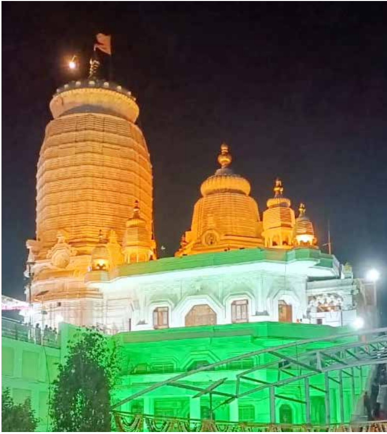
श्रीक्षेत्र राजपुर: अंगारकी चतुर्थीनिमित्त श्री राजुरेश्वर महागणपती मंदिराच्या कळसावर तिरंगी रंगातील आकर्षण विद्युत रोषणाई करण्यात आली.