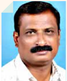
मच्छिंद्र ऐनापुरे जत, जि. सांगली

वैवाहिक संबंधात दुरावा हा आज समाजाच्या चिंतेचा विषय बनला आहे. समाजाच्या प्रत्येक स्तरावर कुटुंबे तुटताना दिसत आहेत. मनाशी जोडण्याची भावना हरवत चालली आहे. संवादहीन सोबत ही आता प्रत्येक घरातली सामान्य गोष्ट झाली आहे. केवळ संभाषणच नाही तर भावनाही लोप पावत चालल्या आहेत. नवरा-बायको विचित्र अशा व्यस्ततेत अडकले आहेत. घरात हजर असलेली आणि अगदी शेजारी बसलेली व्यक्तीही प्रत्यक्षात घरात असूनही अनुपस्थित असते. गंमत अशी की, ज्या स्मार्ट फोनने आपल्या जवळच्या आणि प्रिय व्यक्तींचे हित जाणून घेण्याची सुविधा दिली आहे, तोच आता जवळच्या नात्यांमध्येही दुरावा निर्माण करत आहेत.