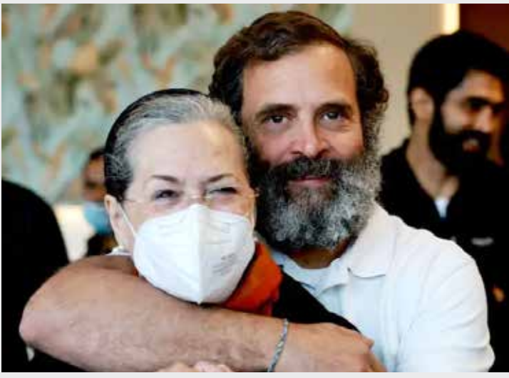
आधुनिक केसरी न्यूज

नवी दिल्ली : देशात माध्यमांमध्ये फक्त हिंदू-मुस्लीम वादावर चर्चा घडवून आणली जाते. मात्र माध्यमांवर दाखवला जात असलेला हा संघर्ष खरा नाही. देशात खूप प्रेम आहे. देशातील सामान्य नागरिक एकमेकांवर प्रेम करतात. देशातील ९० टक्के लोक जात, प्रांत, धर्म या बाबी सोडून एकमेकांवर प्रेम करतात. देशातील लोक प्रेमाने एकमेकांसोबत राहतात. देशातील प्रमुख मुद्द्यांवरून लक्ष विचलित व्हावे म्हणून हिंदू-मुस्लीम संघर्ष दाखवला जातो. हे नरेंद्र मोदी यांचे नव्हे तर अंबानी आणि अदानी यांचे सरकार आहे, असे म्हणत राहुल गांधी यांनी पंतप्रधान मोदी यांच्यावर टीका केली.