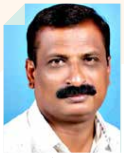
मच्छिंद्र ऐनापुरे जत, जि. सांगली