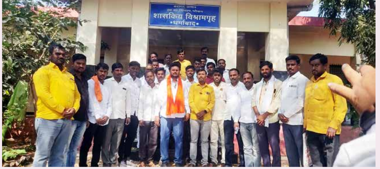
आमच्या मागण्या सोडवण्यासाठी महाराष्ट्र शासन सक्षम आहे आम्ही हक्काने आमच्या सरकारला भांडु पण तेलंगणा राज्यात जाण्यासाठी होत असलेल्या मागणीचे कदापी समर्थन करणार नाही तेथील राज्यकर्त्यांनी आमच्या भावनांचा राजकीय भांडवल करू नये अशी जळजळीत एकमुखी प्रतिक्रिया देखील उपस्थित सरपंच/उपसरपंच यांनी केली. ही मागणी होतेच कशी असाही प्रतिप्रश्न करण्यात आले आहे.