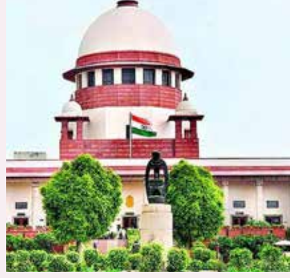
न्यायालयाने हे मत व्यक्त केले. न्यायालयाने ही याचिका फेटाळली. या याचिकेत १२ डिसेंबर २०१८ रोजी सर्वोच्च न्यायालयाच्या न्यायवृंदाच्या बैठकीचा