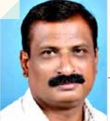
मच्छिंद्र ऐनापुरे जत, जि. सांगली