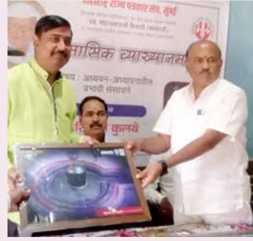
आधुनिक केसरी न्यूज