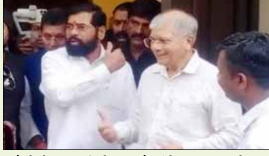
झालेली ही वास्तू पाहिली. यात कोणतही राजकारण नाही. कृपया गैरसमज करून घेऊ नका. ही निव्वळ आणि निव्वळ

मुंबई : राज्यात वंचित बहुजन आघाडी आणि शिवसेनेच्या (उद्धव बाळासाहेब ठाकरे) युतीची चर्चा सुरू असतानाच मुख्यमंत्री एकनाथ शिंदेनी आंबेडकरांची भेट घेतली. यानंतर तर्कवितर्कांना उधाण आलं आहे. मुंबईतील राजगृह येथे प्रकाश आंबेडकरांची भेट घेतल्यानंतर एकनाथ शिंदेनी माध्यमांना प्रतिक्रिया दिली. यात त्यांनी या भेटीत काय झालं हे सांगितलं. ते बुधवारी (१६ नोव्हेंबर) मुंबईत पत्रकारांशी बोलत होते. एकनाथ शिंदे म्हणाले, "मी प्रकाश आंबेडकर यांची सदिच्छा भेट घेतली. डॉ. बाबासाहेब आंबेडकरांच्या पदस्यशांने पवित्र