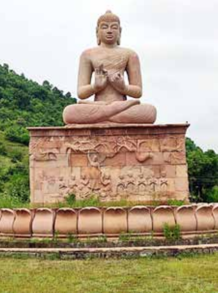
इन्स्टिट्यूट ऑफ पाली अँड बुद्धिज्ञान यांच्या आराखड्यानुसार नालंदा तक्षशिला या सारखे मोठे मोठे विद्यापीठ होणार आहे. त्या ठिकाणी होणा-या विद्ययापीठात दहा हजार विद्यार्थी शिक्षण

सोयगाव : तालुक्यातील फर्दापूर येथील अजिंठा बुद्ध लेणी येथे डॉ. बाबासाहेब आंबेडकर रिसर्च इन्स्टिट्यूट ऑफ पाली अँड बुद्धिज्ञान धम्माचलच्या वतीने दि. ८ नोव्हेंबर (कार्तिक पौर्णिमा) मंगळवार २०२२ रोजी १७ व्या अखिल भारतीय धम्म परिषदेचे आयोजन करण्यात आले असून नियोजित कार्यक्रमाचे ठिकाण धम्माचल अजिंठा बुद्ध लेणी फर्दापूर हे असून जगप्रसिद्ध असलेली अजिंठा बुद्ध लेणी सहाद्रीच्या पर्वतरांगेमध्ये फर्दापूर गावापासून दोन किलोमीटर अंतरावर आहे. तेथे असलेला धम्माचलचा परिसर हा एकूण ७४ एकरचा असून तेथे तथागत गौतम बुद्धांची मूर्ती बनवण्यासाठी राजस्थान राज्यामधून दगड आणण्यात आला. त्या दगडामधून दोन कारागिराने टप्प्याटप्प्याने त्या दगडाचे काम करून ३२ फूट उंच अशी भव्य दिव्य ध्यानस्थ आसनात असलेली तथागत गौतम बुद्धांची मूर्ती सन २०१३ मध्ये प्रतिष्ठापित केली. भविष्यामध्ये धम्माचलच्या ७४ एकर जमीन परिसरामध्ये डॉक्टर बाबासाहेब आंबेडकर