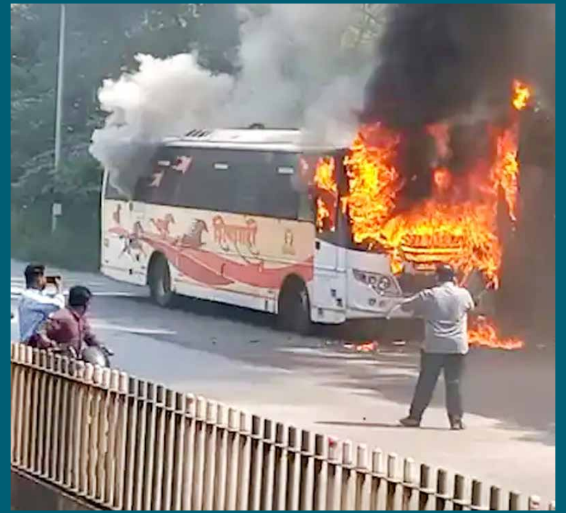
पुण्यातील येरवडा शास्त्रीचौकात शिवशाही बसने अचानक पेट घेतला. सुदैवाने यात कोणतीही जीवितहानी झाली नाही.