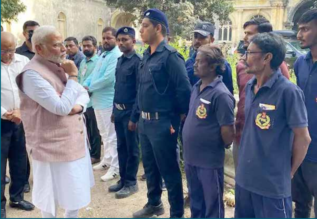
मोरबी दुर्धटनास्थळी पंतप्रधान नरेंद्र मोदी यांनी भेट दिली आहे. यावेळी त्यांनी बचाव आणि मदत कार्यात सहभागी असलेल्या लोकांची भेट घेतली.