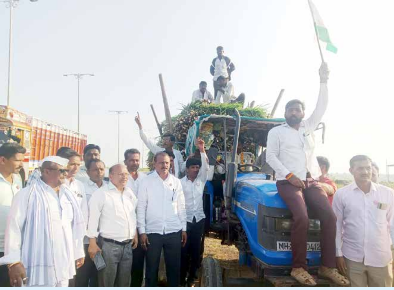
आधुनिक केसरी न्यूज

कन्नड : येथे स्वाभिमानी शेतकरी संघटनेच्या पहिल्या ऊस परिषदेमध्ये झालेले उरावाचे निवेदन देण्यासाठी स्वाभिमानी शेतकरी संघटनेचे पदाधिकारी सोमवारी कन्नड कारखाना येथील बारामती अॅग्रो येथील कार्यालयात गेले असता. कारखाना प्रशासनाने निवेदन घेण्यास स्पष्ट नकार देऊन बाहेरचा रस्ता दाखवला. नंतर शेतकरी व स्वाभिमानी शेतकरी संघटनेचे पदाधिकारी आक्रमक झाल्यानंतर निवेदन स्वीकारले. मात्र