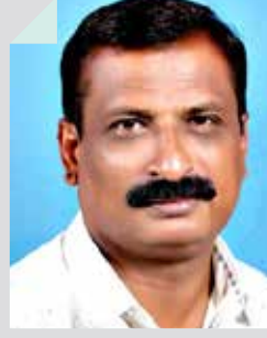
मच्छिंद्र ऐनापुरे जत, जि. सांगली