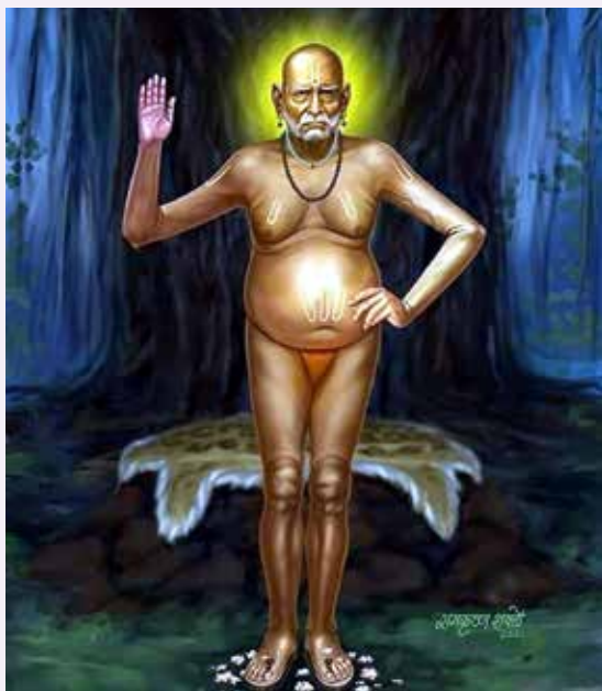
खुर्ची ठेवायची आणि तिथे प्रत्यक्ष परमेश्वरच स्थानापन्न झालेला आहे असं समजून समोर कोणी असताना आपण जसं त्या व्यक्तीशी संवाद साधतो ना तसाच संवाद खुर्चीत बसलेल्या परमेश्वराशी

एकदा एक तरुण मुलगी एका संतमहात्म्याकडे गेली आणि त्यांना आर्जवानं विनंती करत म्हणाली, “माझे बाबा गेले अनेक महिने आजारी असल्यानं त्यांना स्वतःहून काहीही हालचाल तर करता येत नाहीच, परंतु ते रुग्णशय्येला खिळून आहेत. तुम्ही एकदा येऊन त्यांना भेटाल का?” “का नाही...? नक्कीच येईन मी...” करुणासागर असलेले संत उद्गारले. त्या घरी भेट दिली असता, त्या संतांना असं दिसलं की रुग्णशय्येला खिळून असलेल्या त्या वृद्ध व्यक्तीच्या पलंगाशेजारी एक रिकामी खुर्चीही ठेवलेली आहे. “तुम्ही कदाचित् मी येण्याचीच वाट पहात होता असं दिसतंय?” त्या खुर्चीकडे पहात संत म्हणाले. “नाही...नाही...तसं नाहीये.” वृद्ध व्यक्ती उद्गारली. त्यानंतर ती वृद्ध व्यक्ती विनंतीच्या स्वरात म्हणाली, “हे महाराज! कृपया खोलीचं दार लावून घ्याल का?” संतांनी दार बंद केल्यावर, वृद्ध व्यक्ती पुन्हा बोलू लागली, “खरं सांगायचं तर, या क्षणापर्यंत, मी या रिकाम्या खुर्चीचं रहस्य कोणापुढेही उघड केलेलं नाही...अगदी माझ्या लाडक्या मुलीलाही ते ठाऊक नाहीये. तुम्हाला म्हणून सांगतो, संपूर्ण आयुष्यभर, प्रार्थना कशी करतात ते मला कधीच समजलं नाही. नित्यनियमानं देवळात जाण्याचा परिपाठ कटाक्षानं पाळूनही मला प्रार्थनेचा खरा अर्थ कधी समजला नाही.” “परंतु चारएक वर्षांपूर्वी माझा एक मित्र मला भेटायला आला असता, त्यानं मला सांगितलं की मी माझी प्रार्थना थेट परमेश्वरालाच सांगू शकतो. त्या मित्रानं मला सांगितलं की आपल्यासमोर एक रिकामी