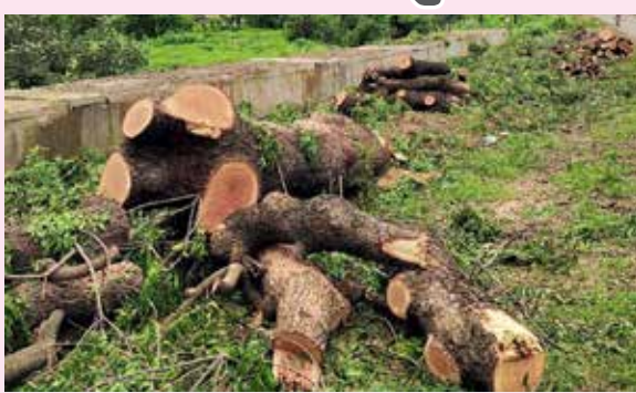
शकेल. १९७० मध्ये उत्तराखंडला अलकनंदेच्या पुराने जबर तडाखा हाणला. नदीचे

पूर, दरडी कोसळणे, गाळ वाहून येणे, जमिनीची धूप होणे या गोष्टी तशा स्थानिकांना नवीन नव्हत्या. पण १९७० च्या पुराने या सगळ्या लोकांची भीतीने अक्षरशः पाचावर धारण बसली. या पुराचे रूप अत्यंत विनाशकारी आणि भयचकित करणारे होते. या पुराच्या राक्षसी प्रवाहात कित्येक पूल वाहून गेले, शेकडो बसेस वाहून गेल्या. शेकडो एकर शेतजमिनीतली पिके नष्ट झाली, शेतातील माती वाहून गेली, गुरेवोरे वाहून गेली, माणसे बेघर झाली. शेकडो लोकांचा मृत्यू झाला.