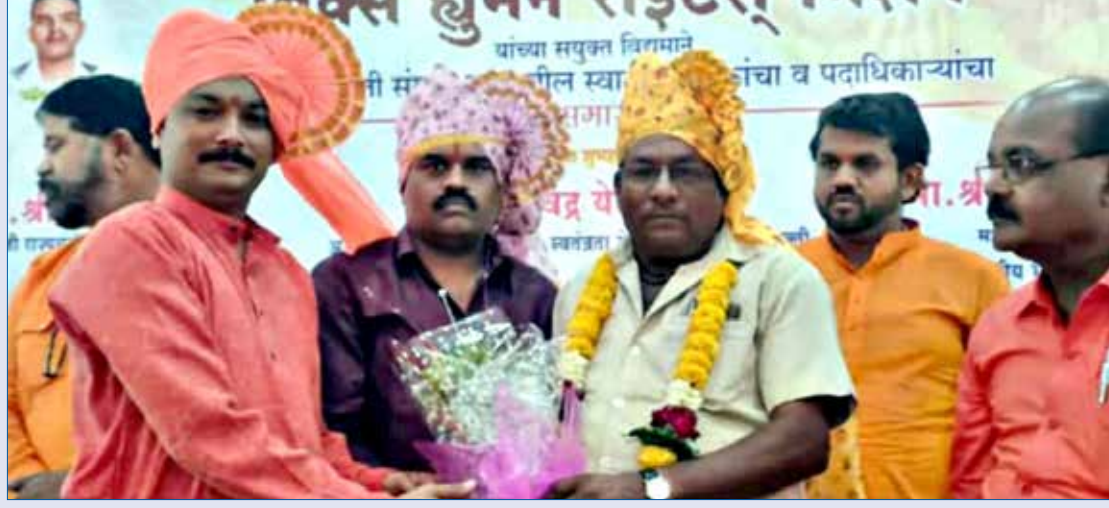
यावेळी सोयगाव,सिल्लोड व औरंगाबाद भ्रष्टाचार निर्मूलन संघर्ष समितीचे पदाधिकारी उपस्थित होते.दिनांक १८ सप्टेंबर रोजी आभ्यास शिबीर संपन्न झाले आसुन गेल्या वर्षभरात