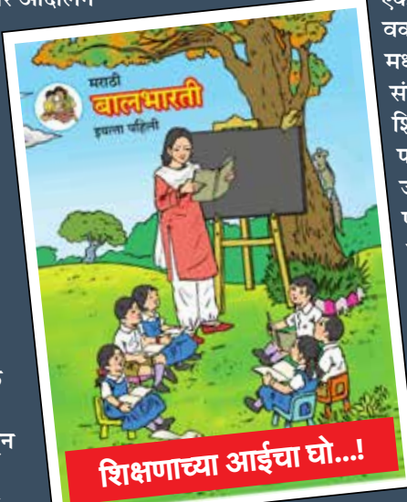
शिक्षणाच्या आईचा घो...!

तर तुळजापूर मतदारसंघाचे शेतकऱ्यांना त्यांच्या हक्काचा विमा मिळवून देण्यासाठी नावलौकिक असणारे धडाकेबाज आमदार यांच्या तुळजापूर तालुक्यात 7 हजार610 एवढी कमी असणारी पाठ्यपुस्तक जसं पीक विम्यासाठी न्यायालयीन लढा उभा करतात, असाच एखादा लढा पुस्तकासाठी उभा करणार का? खासदार साहेबांनी जनतेसाठी सतत कार्यरत असणारा मोबाईल एक फोन या चिमुकल्यांच्या पाठ्यपुस्तकासाठी लावला तर 55हजार696 पाठ्यपुस्तकांचा प्रश्न मिटेल का? शेतकऱ्यांना आम्हीच विमा मिळून दिला यात चढवडीने भाषण करण्यात व्यस्त असणारे खासदार आमदार जिल्ह्याला पाठ्यपुस्तक मिळून मीच दिले याबाबत कोण श्रेय घेतात व आमच्या शाळेला पुस्तक मिळाल्याशिवाय आम्ही शाळा उघडणार नाही असेही कुठली शिक्षक संघटना आंदोलन करण्यास उभे राहते का? हे पाहण्यास जिल्हातील समस्त पालकवर्ग वाट पाहत आहे. "चिमुकल्यांना शिक्षणाचे बाळकडू पाजत असताना शाळेत पाठ्यपुस्तकांचीच कमतरता असेल तर या लहानग्यांना लहानपणीच राजकारणाच बाळकडूपासून तुमच्या मागे कार्यकर्ता म्हणून पाठवायचं का." असाच सवाल समस्त जिल्ह्यामधून घुमत आहे.