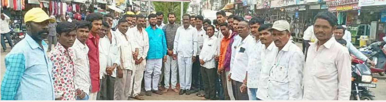
आधुनिक केसरी न्यूज

सिल्लोड : आपल्या जागतिक साहित्याच्या आणि लेखणीच्या बळावर छत्रपती शिवरायांचा इतिहास रशियापर्यंत पोहोचविणारे साहित्याचे महामेरु साहित्यरत्न लोकशाहीर अण्णाभाऊ साठे यांचा गौरव म्हणून रशियाच्या प्रजासत्ताक दिनी ता. 14 सप्टेंबर रोजी रशियाच्या मॉस्को शहरातील शासकीय वाचनालयात साहित्यरत्न अण्णाभाऊंच्या पुतळ्याचे व तैलचित्राचे अनावरण झाले. या अविस्मरणीय क्षणाचा आनंदोत्सव व जल्लोष "मातंग एकता आंदोलन" या राज्यव्यापी संघटनेच्या वतीने सिल्लोड शहरातील साहित्यरत्न अण्णाभाऊ साठे चौकात