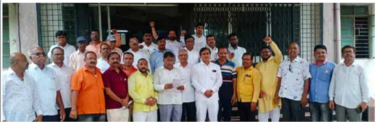
आधुनिक केसरी न्यूज