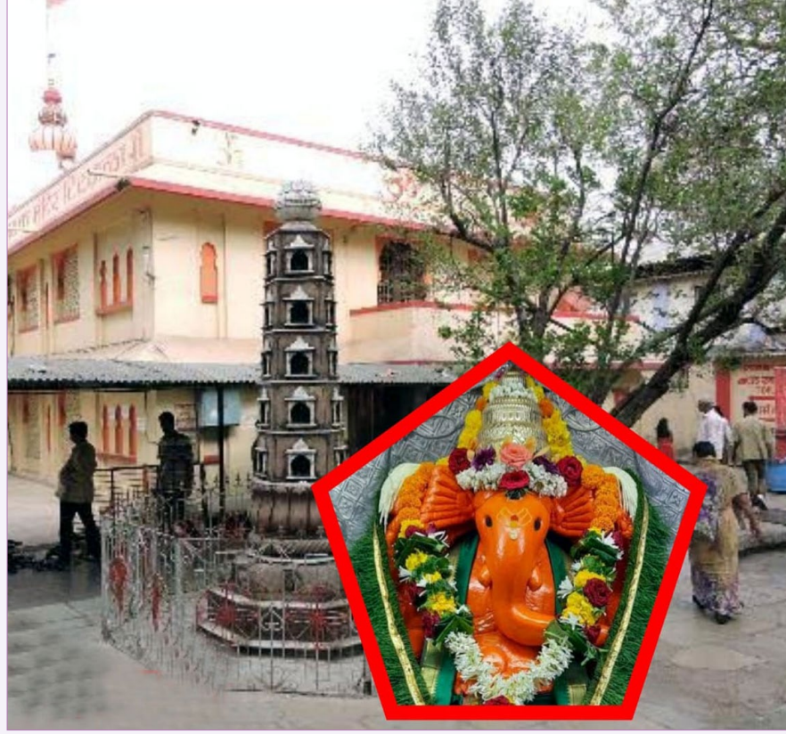
ऋषींचा आश्रम होता. शकुंतला इथेच वाढली. त्यामुळेही या ठिकाणाला एक प्राचीन महत्त्व आहे.

दुर्वास ऋषींचे यथायोग्य स्वागत न केल्यामुळे शकुंतलेला शाप मिळाला आणि राजा दुष्यन्ताला शकुंतलेचा विसर पडला. उत्साहाने पतीगृही गेलेली नवीन शकुंतला त्यामुळे आल्या पावली परत फिरली. कण्व ऋषींकडे परत आलेल्या या शकुंतलेने गणपतीची आराधना केली आणि दुष्यन्ताला सारे काही आठवले. शकुंतलेला तिचे प्रेम परत मिळवून देणारा गणपती म्हणजेच टिटवाळ्याचा महागणपती. महाराष्ट्रातल्या अष्टविनायकांप्रमाणेच हे श्रीगणपती क्षेत्रही प्रसिद्ध आहे. याच परिसरात पूर्वी कण्व