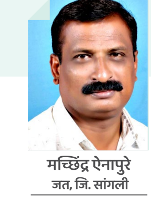
मच्छिंद्र ऐनापुरे जत, जि. सांगली

गेल्या दोन दशकांत भारतातील स्त्री शिक्षणाची स्थिती सुधारली आहे. प्रजनन दर कमी झाला आहे. या कारणांमुळे जगभरात महिलांचा कामातील सहभाग वाढताना दिसत आहे, परंतु भारतात तसे होताना दिसत नाही. उलट कर्मचाऱ्यांमध्ये जेवढी भर पडत आहे, त्यापेक्षा जास्त स्त्रिया कामातून बाहेर पडत आहेत. तसे स्त्रिया बँकांमध्ये काम करताना चांगल्या संख्येने दिसतील, महानगरे आणि मोठ्या शहरांमध्ये रेल्वे काउंटरवर त्यांची उपस्थिती कमी आहे, काही विमाने उडवतात, परंतु महिला बस कंडक्टर, टॅक्सी आणि ऑटो रिक्शाचालक अशा क्षेत्रात संख्या नगण्य आहे.