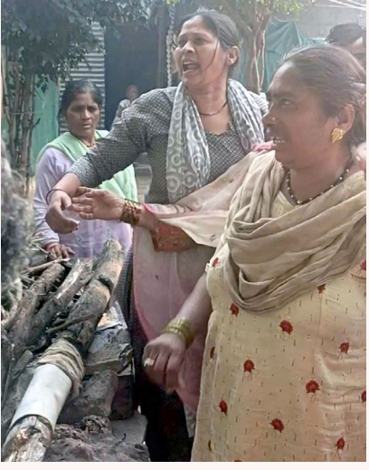
आधुनिक केसरी न्यूज

पिशोर पोलीस ठाण्यात गुन्हा दाखल मात्र आरोपी अद्याप मोकाट