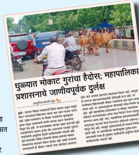
धुळ्यात मोकाट गुरांचा हैदोस; महापालिका प्रशासनाचे जाणीवपूर्वक दुर्लक्ष