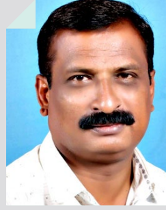
मच्छिंद्र ऐनापुरे जत, जि. सांगली