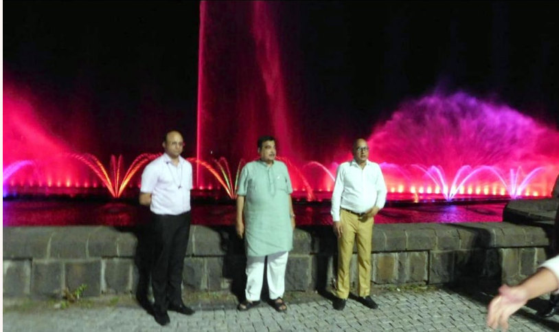
भर घालणाऱ्या फुटाळा म्युझिकल फाऊंटन आणि लाईट-शो प्रकल्पाची उद्घाटनावरून आज केंद्रीय मंत्री नितिन गडकरी यांनी

नागपूर : नागपूरच्या प्रसिद्ध फुटाळा तलावात असणारे संगीत कारंजे नागपूरचा इतिहास सांगणार असून या इतिहासाची हिंदी मधली कॉमेंट्री अमिताभ बच्चन यांच्या आवाजात तर मराठीतली कॉमेंट्री नाना पाटेकर यांच्या आवाजात राहिल. हे कारंजे पाहण्यासाठी फुटाळा तलावाजवळ दर्शक गॅलरी ही 400 आसन क्षमतेची राहणार असून फुटाळ्याच्या पुढेच बारा मजली फूड-प्लाझा 1100 वाहनांच्या पार्किंग व्यवस्थेसह उभारण्यात येणार आहे, अशी माहिती केंद्रीय महामार्ग मंत्री नितिन गडकरी यांनी आज नागपूर मध्ये दिली. केंद्रीय मंत्री नितिन गडकरी यांच्या संकल्पनेतून साकारलेल्या आणि नागपूरच्या सौंदर्यात