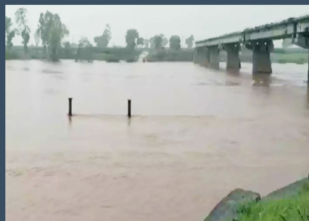
सुमारास हा बंधारा देखील पाण्याखाली गेला. आज सकाळी येथील पाणी पातळी २४ फुटांवर गेली आहे. पंचगंगा नदीची इशारा पातळी ३९ फूट आहे तर थोका पातळी ४३ फूट इतकी

आधार घ्यावा लागत आहे.तर दुसऱ्या बाजूला धरण क्षेत्रामध्ये ही मोठ्या प्रमाणात पाऊस सुरू असल्याने राधानगरी धरणातून ही पाण्याचा विसर्ग सुरू करण्यात आला आहे. यामुळे पंचगंगा नदीच्या पाणी पातळीत झपाट्याने वाढ होत आहे.गेल्या सात तासांमध्येच राजाराम बंधाराच्या पाणी पातळी ७ फुटांनी वाढ झाल्याने यंत्रणा देखील हायअलर्टवर गेली आहे. यापूर्वी तीनवेळा महापुराचा सामना केलेल्या कोल्हापूर जिल्ह्यात पुन्हा एकदा पुरसदृश्य स्थिती निर्माण होत आहे. कारण गेल्या दोन ते तीन दिवसापासून सुरू असलेल्या पावसाने काल सोमवार सकाळपासून कोल्हापूर शहरासह जिल्ह्यात पावसाने जोर धरला आहे. धरण क्षेत्रात मोठ्या प्रमाणात पाऊस पडत असल्याने राधानगरी धरणातून क्युसेक पाण्याचा विसर्ग सुरू करण्यात आला आहे. यामुळे पंचगंगा पाणी पातळीत झपाट्याने वाढ होत असून गेल्या ७२ तासात ६ बंधारे पाण्याखाली गेले आहेत. तर कसबा बावडा येथील राजाराम बंधान्याच्या पाणी पातळीत ही झपाट्याने वाढ झाली असून काल रात्रीच्या आठ वाजताच्या