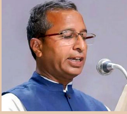
आधुनिक केसरी न्यूज

चंदीगड : भ्रष्टाचाराच्या प्रकरणांमुळे पंजाबमधील वातावरण ढवळून निघाले आहे. पंजाबचे मुख्यमंत्री भगवंत मान यांनी आप सरकारमधील आरोग्यमंत्री डॉ. विजय सिंगला यांची भ्रष्टाचाराच्या आरोपावरून हकालपट्टी केली आहे. पंजाब पोलिसांच्या लाचलुचपत प्रतिबंधक शाखेकडून त्यांच्यावर भ्रष्टाचाराचा गुन्हा दाखल करण्यात आला असून अटक करण्यात आल्याची माहिती आहे. सगळ्यात महत्वाचे म्हणजे पंजाबचे आरोग्यमंत्री असताना विजय सिंगला यांनी २३ मार्च रोजी भ्रष्टाचार खपवून घेणार नसल्याची घोषणा केली होती. इतकेच नाहीतर भ्रष्टाचार्यांवर शून्य सहनशीलता दाखवली जाणार असा दावाही त्यांनी केला होता. त्यांच्या या विधानानंतर अगदी ६२ दिवसांनी म्हणजेच २४ मे रोजीच ते भ्रष्टाचाराच्या प्रकरणात अडकले. भगवंत मान यांच्या सरकारचे हे अत्यंत मोठे आणि धाडसी पाऊल असल्याची सध्या चर्चा सुरू आहे.